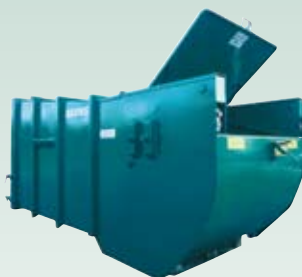
BPSK/BPS Komprimator for restavfall