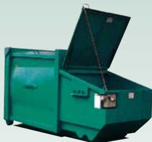
BPA Komprimator for papp og papir