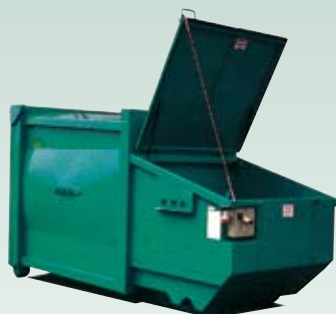
BPA Komprimator for papp og papir