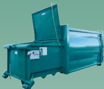
SP 1102 D Komprimator for papp og papir