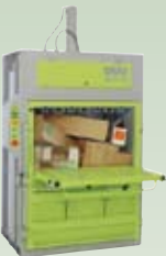
DIXI 25S, 30S 25 – 30 tonn presskraft Ballevekt 250 – 360 kg