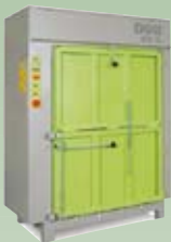
DIXI 18S 18 tonn presskraft Ballevekt 140 – 220 kg