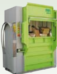
DIXI 60S, 80S 60 – 80 tonn presskraft Ballevekt 340 – 700 kg