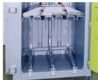
Presstempel og utkaster