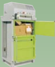
DIXI 5-SK 6 tonn presskraft Ballevekt 40-60 kg