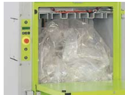
Pressing av plastfolie