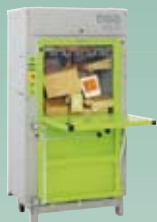
DIXI 10 S 8,5 tonn presskraft Ballevikt 50-80 kg