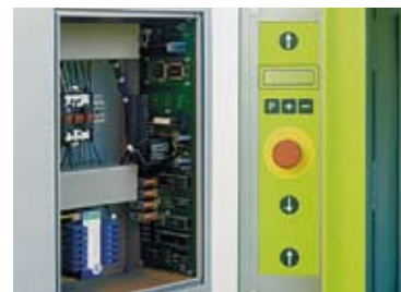
Enkelt vedlikehold: Prosessorkontroll området.