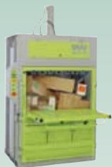
DIXI 25 S, 30 S 25 – 30 tonn presskraft Ballevikt 250 – 360 kg