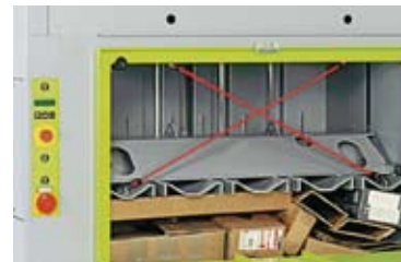
Robust: Presstempel med føringer på begge sider.