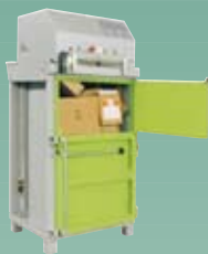
DIXI 5 S-K 6 tonn presskraft Ballevikt 40-60 kg