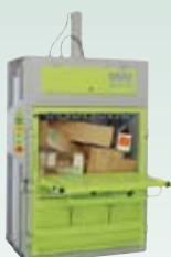
DIXI 25 S, 30 S 25-30 tonn presskraft Ballevekt 250-360 kg