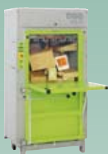
DIXI 10 S 8,5 tonn presskraft Ballevekt 50-80 kg