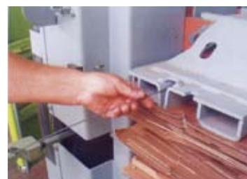
Enkel binding med ståltråd