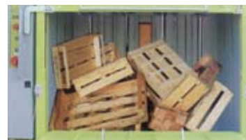
Paller og kasser av tre er ikke noe problem