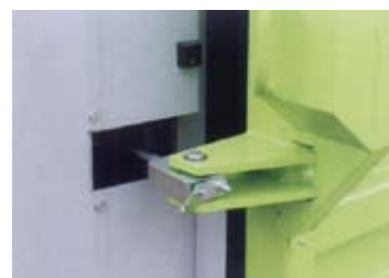
Den hydrauliske åpningsmekanismen