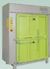
DIXI 18 S 18 tonn presskraft Ballevekt 140-220 kg